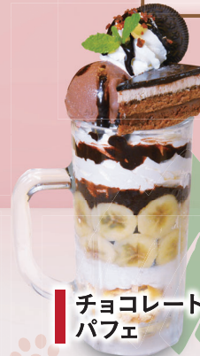
チョコレート パフェ