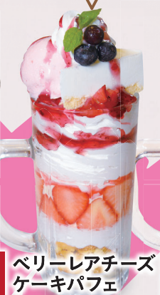
ベリーレアチーズ ケーキパフェ