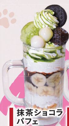
抹茶ショコラ パフェ