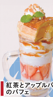
紅茶とアップルパイ のパフェ