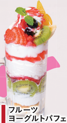
フルーツ ヨーグルトパフェ