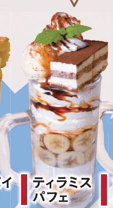
ティラミス パフェ