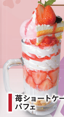
苺ショートケーキ パフェ