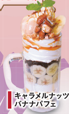
キャラメルナッツ バナナパフェ