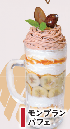
モンブラン パフェ