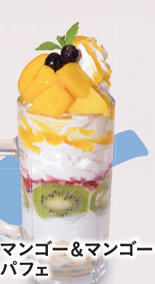
マンゴー&マンゴー パフェ