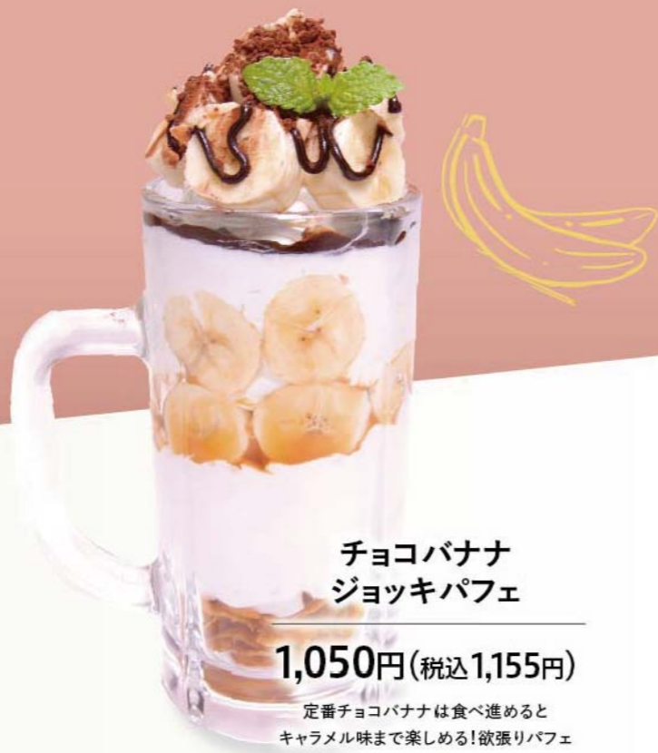
チョコバナナ ジョッキパフェ