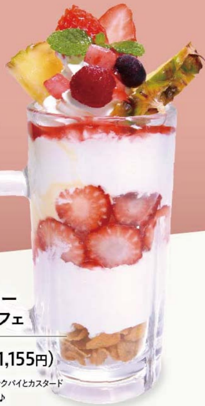
ストロベリー ジョッキパフェ