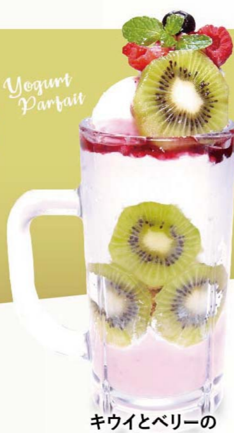
キウイとベリーの ヨーグルトパフェ