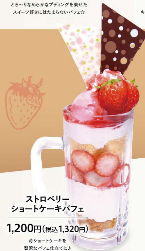
ストロベリー ショートケーキパフェ