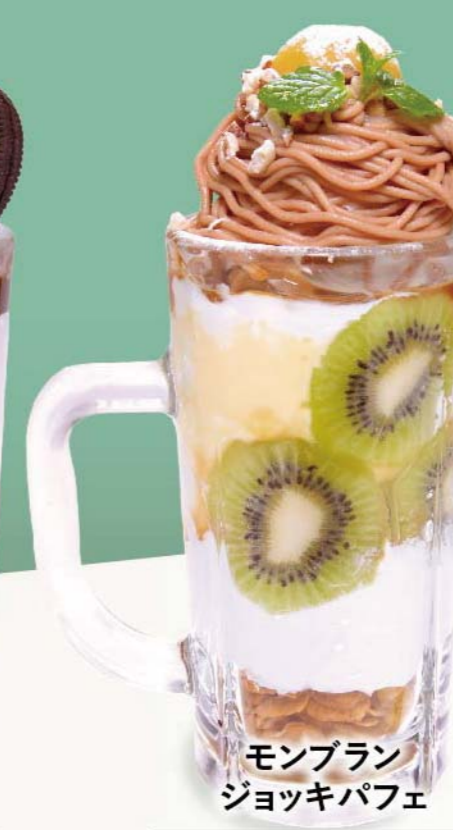
モンブラン ジョッキパフェ