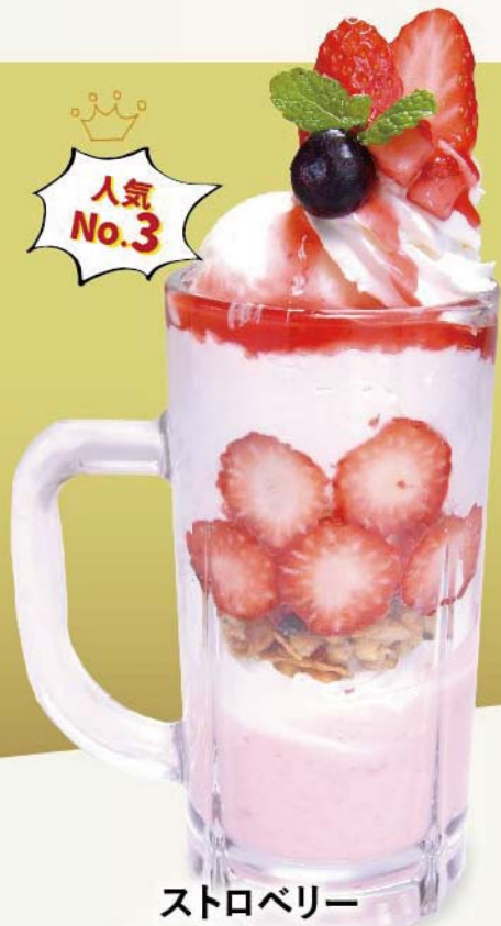
ストロベリー ヨーグルトパフェ