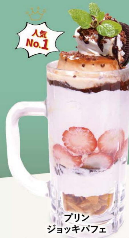
プリン ジョッキパフェ