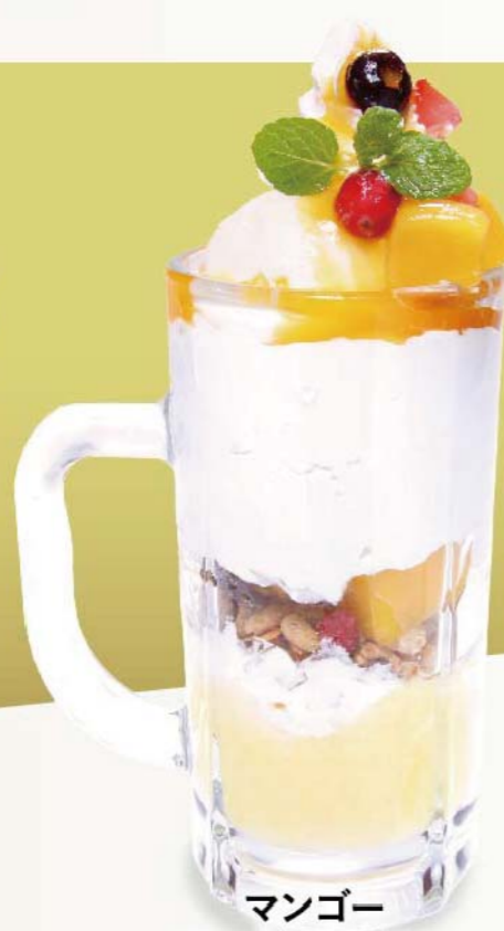
マンゴー ヨーグルトパフェ