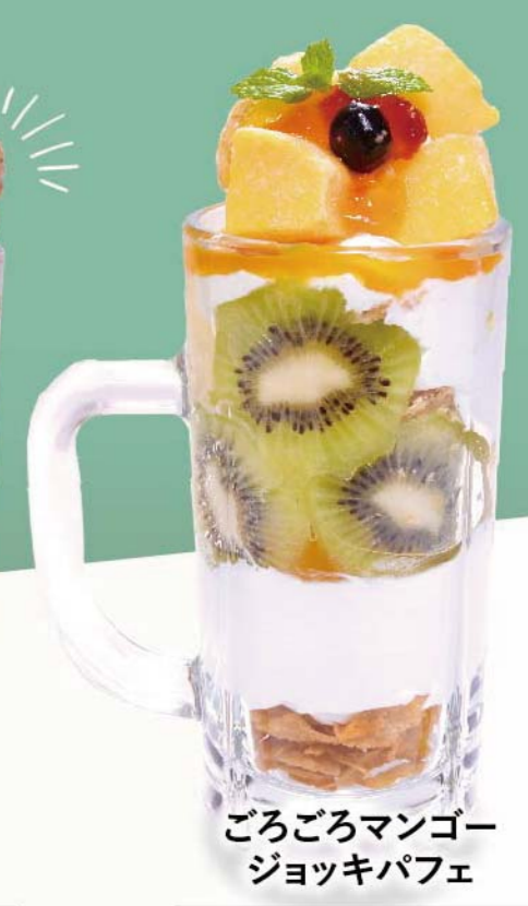
ごろごろマンゴー ジョッキパフェ