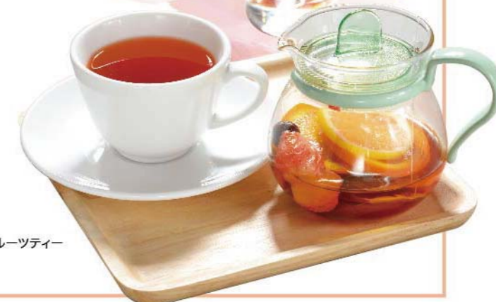
ホットフルーツティー