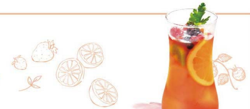
アイスフルーツティー

たくさんのフルーツを贅沢に入れたさわやかな優しい甘みのアイスティー。紅茶とフルーツのハーモニーを楽しんでください。