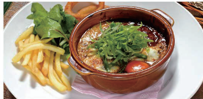
DOTE煮込みハンバーグ 900円(税込990円)