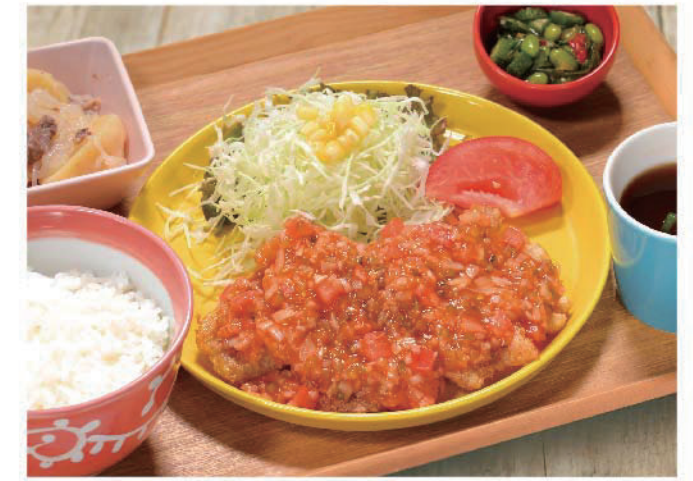
粒つぶ野菜のポークチリ定食 1,100円(税込1,210円)