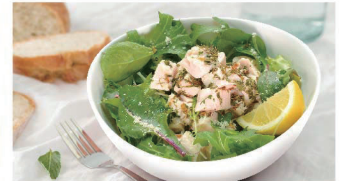
■レモンハーブチキンサラダ 450円(税込495円)