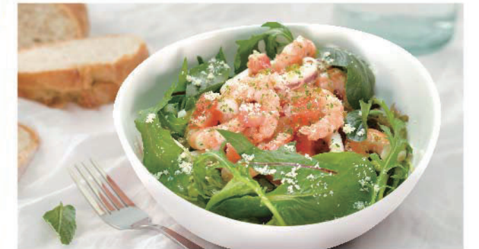
■シーフードマリネサラダ 500円(税込550円)