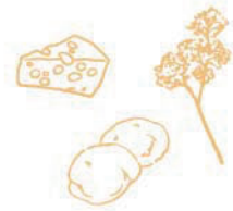
Catsフライポテト 400円(税込440円)