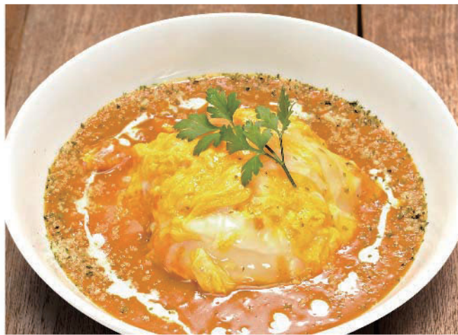
インディアンオムカレー チキンライス 850円(税込935円)