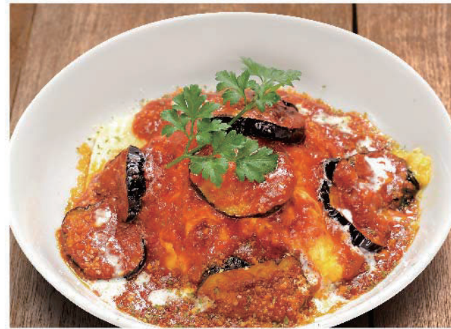
茄子のミートソースオムライス チキンライス 850円(税込935円)