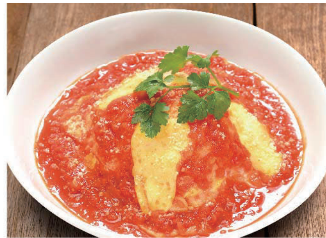
完熟トマトとモッツアレラのオムライス チキンライス 900円(税込990円)