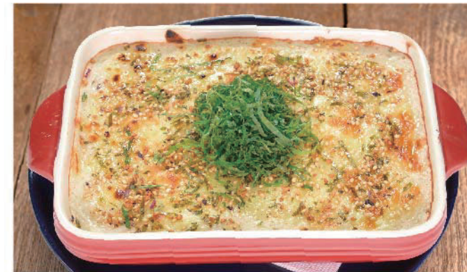
とろろと梅しらすの 和風ドリア 900円(税込990円)