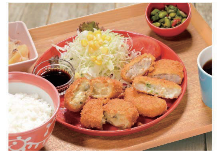
こだわりミックスコロケ定食 1,200円(税込1,320円) あさりクリームコロケ2個、里芋とインゲンのコロケ、蓮根メンチコロケ