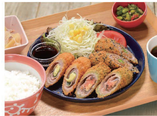
3種のロールカツ定食 1,200円(税込1,320円) 青じそチーズ、海苔明太チーズ、梅胡麻インゲン