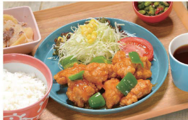
オレンジチキン定食 1,000円(税込1,100円)