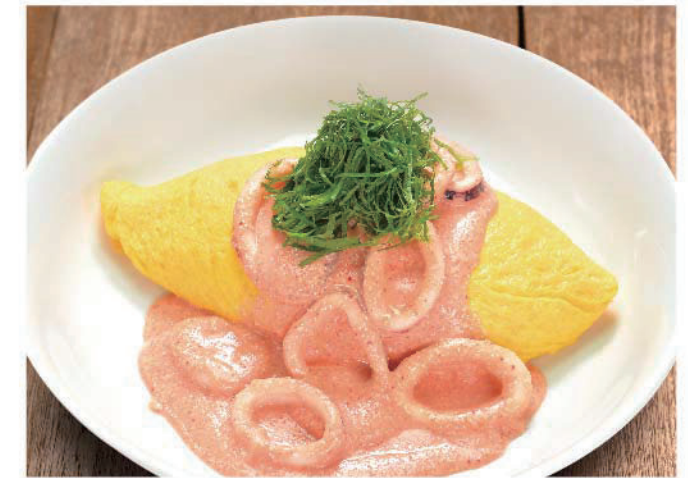
明太子クリームオムライス 十六穀米バターライス 950円(税込1,045円)