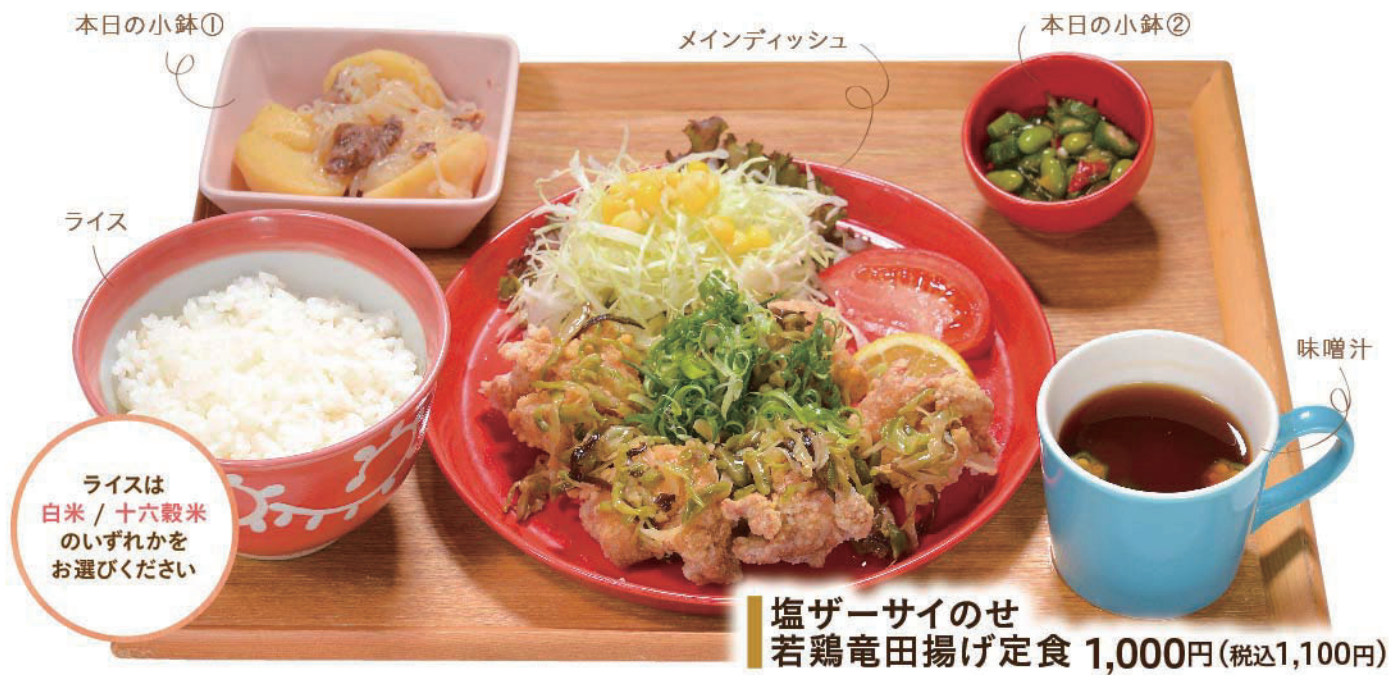
塩ザーサイのせ 若鶏竜田揚げ定食 1,000円(税込1,100円)