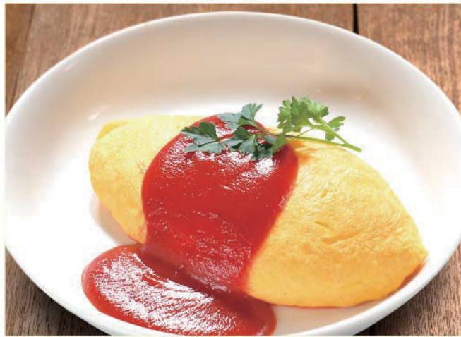
クラシックオムライス チキンライス 850円(税込935円)