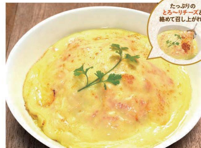
ビストロチーズオムライス チキンライス 1,100円(税込1,210円)