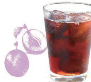
余市プルーンサワー