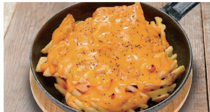
■チーズフライポテト 500円(税込550円)