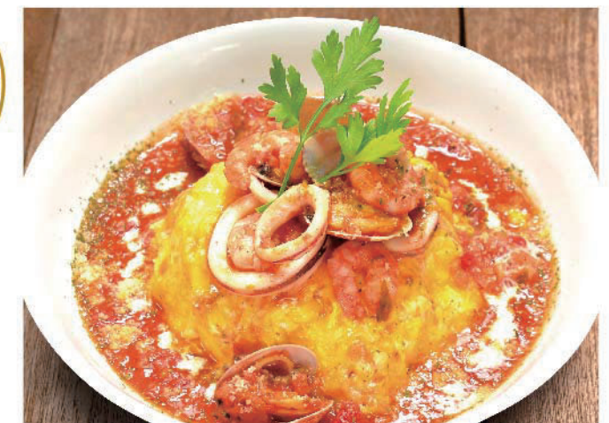
スパイシープライヤベースのオムライス 十六穀米バターライス 1,100円(税込1,210円)