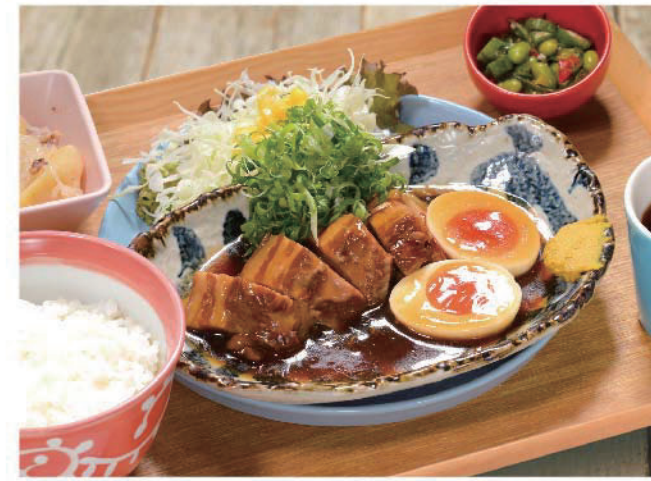
ホロホロ豚角煮定食 1,100円(税込1,210円)