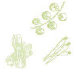
■玉子とベーコンのタルタルサラダ 400円(税込440円)

たっぷり野菜×トッピングで ヘルシーだけとお腹も満足! 相性抜群のドレッシングと 共に楽しみください