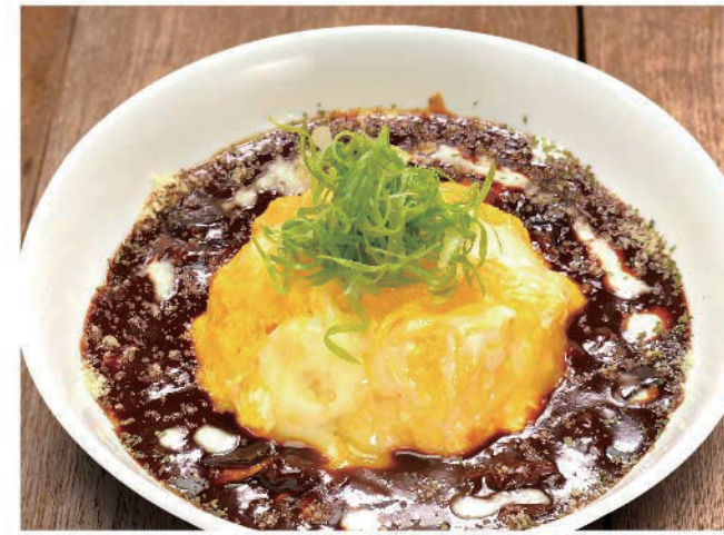
DOTEオムライス 十六穀米バターライス 900円(税込990円)