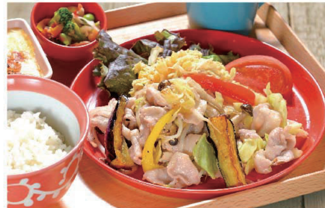
たっぷり野菜の 肉野菜炒め定食 1,000円(税込1,100円)