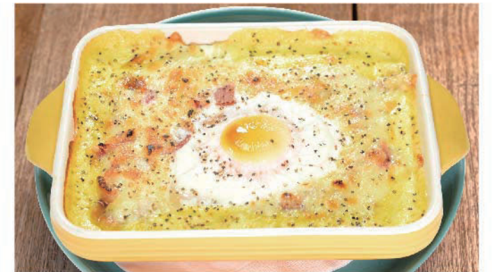
濃厚カルボナーラ風ドリア 950円(税込1,045円)