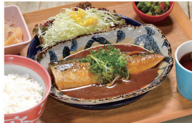
サバの味噌煮定食 1,000円(税込1,100円)