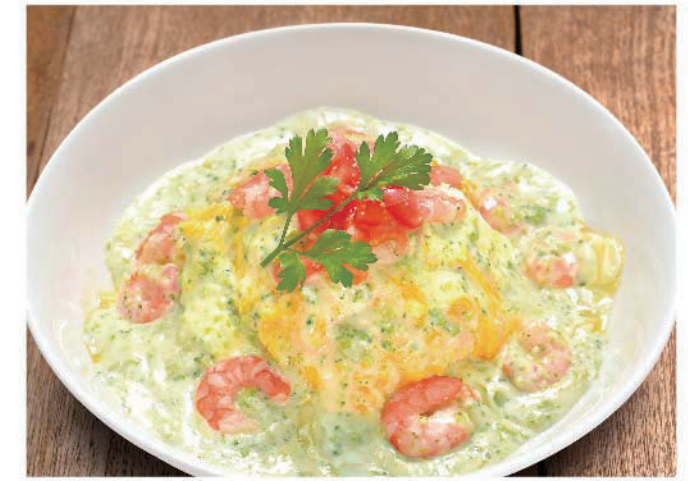
海老のブロッコリクリームオムライス 十六穀米バターライス 950円(税込1,045円)