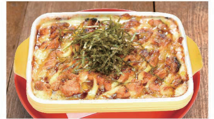
照り焼きチキンの和風ドリア 900円(税込990円)