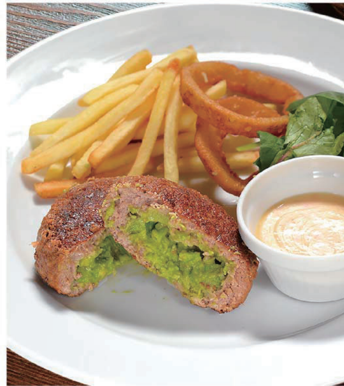
アボカドハンバーグ 900円(税込990円)