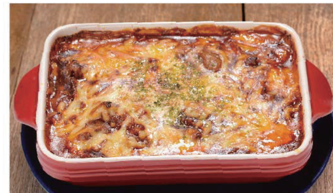
特製ビーフハヤシドリア 950円(税込1,045円)