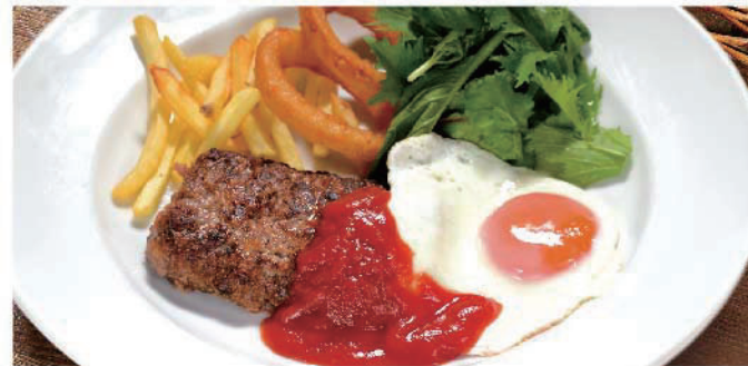
月見チーズインハンバーグ 850円(税込935円)