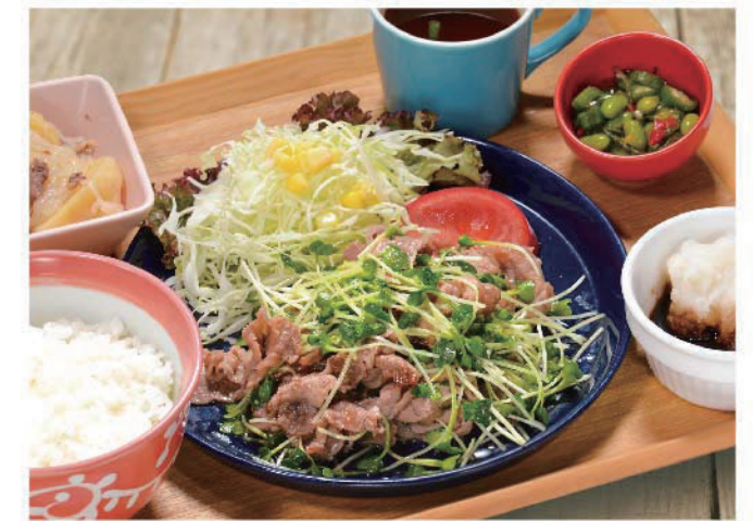
たっぷり貝割れの牛肉炒め定食 1,100円(税込1,210円)