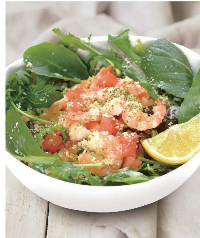
■ガーリックシュリンプサラダ 450円(税込495円)