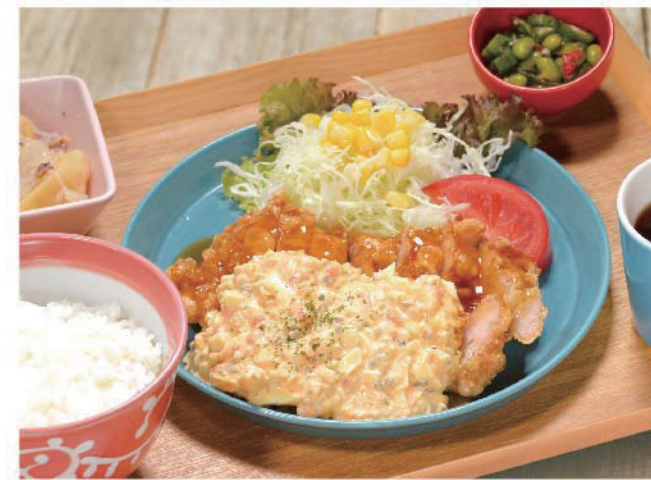
卵タルタルのチキン南蛮定食 1,100円(税込1,210円)