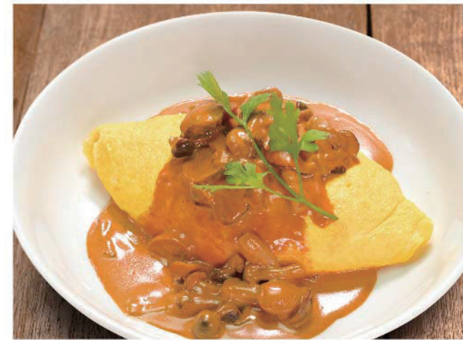
キノコクリームオムライス チキンライス 950円(税込1,045円)