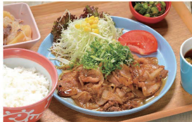
たれ漬け熟成 ポークジンジャー定食 1,000円(税込1,100円)