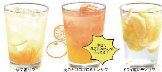
ゆず蜜サワー 丸ごとゴロゴロミカンサワー ドライ塩レモンサワー