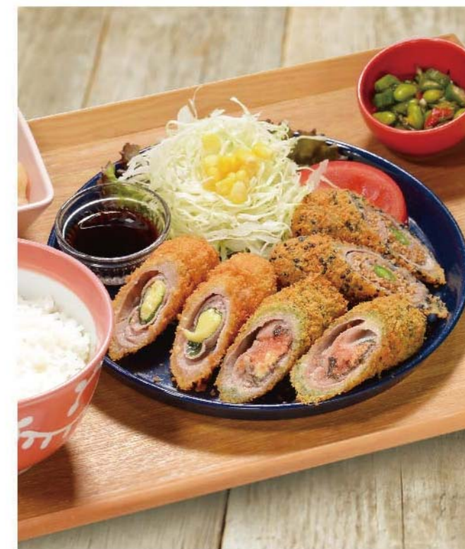
3種のロールカツ定食 青じそチーズ、海苔明太チーズ、梅胡麻インゲン ..... 1,300円(税込1,430円)