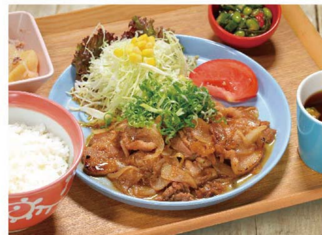
たれ漬け熟成豚のしょうが焼き定食 ..... 1,100円(税込1,210円)