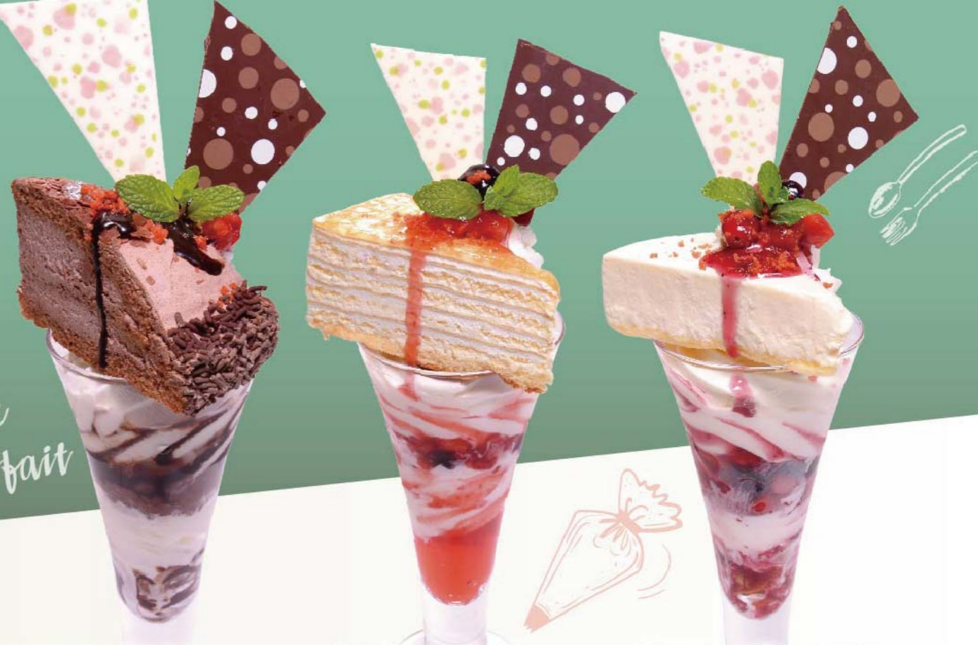
ショコラケーキパフェ