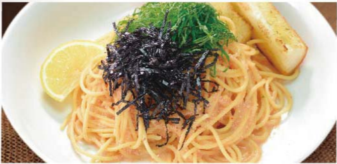
青じそたっぷり明太バター 950円(税込1,045円)