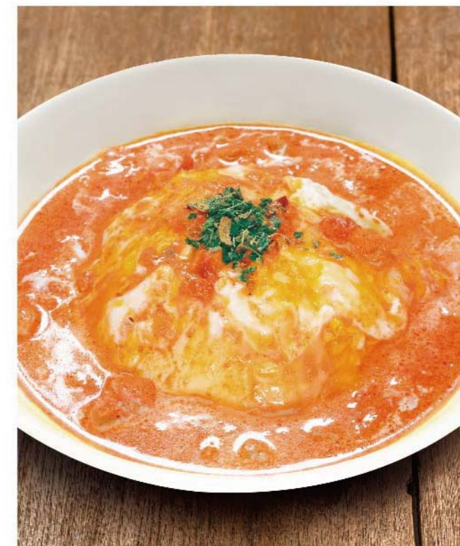
バタチキオムライス 十六穀米バターライス ..... 1,050円(税込1,155円)