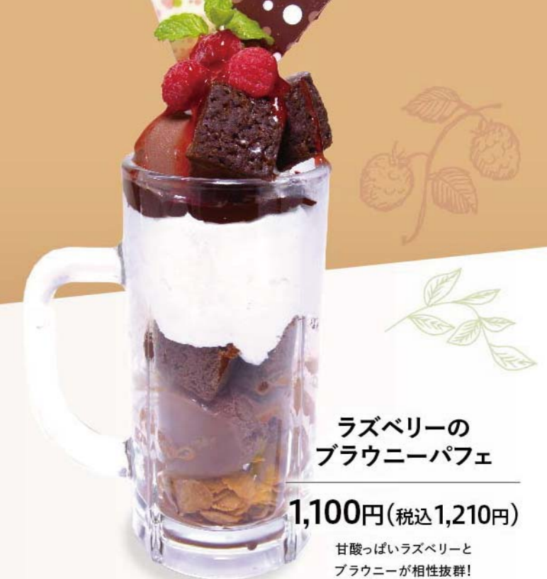
ラズベリーの ブラウニーパフェ