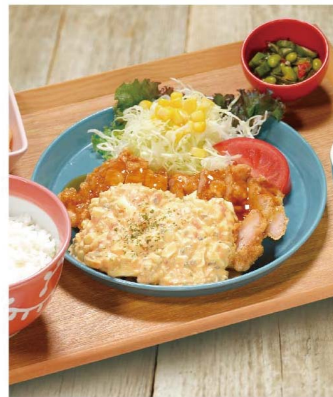
卵タルタルのチキン南蛮定食 ..... 1,200円(税込1,320円)