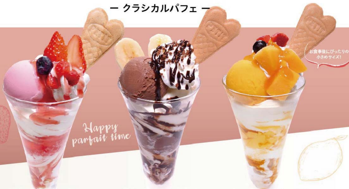
ストロベリーパフェ