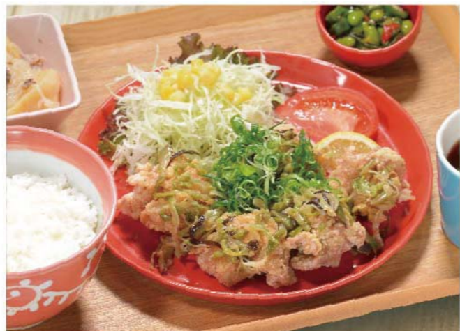
塩ザーサイのせ鶏の竜田揚げ定食 ..... 1,100円(税込1,210円)