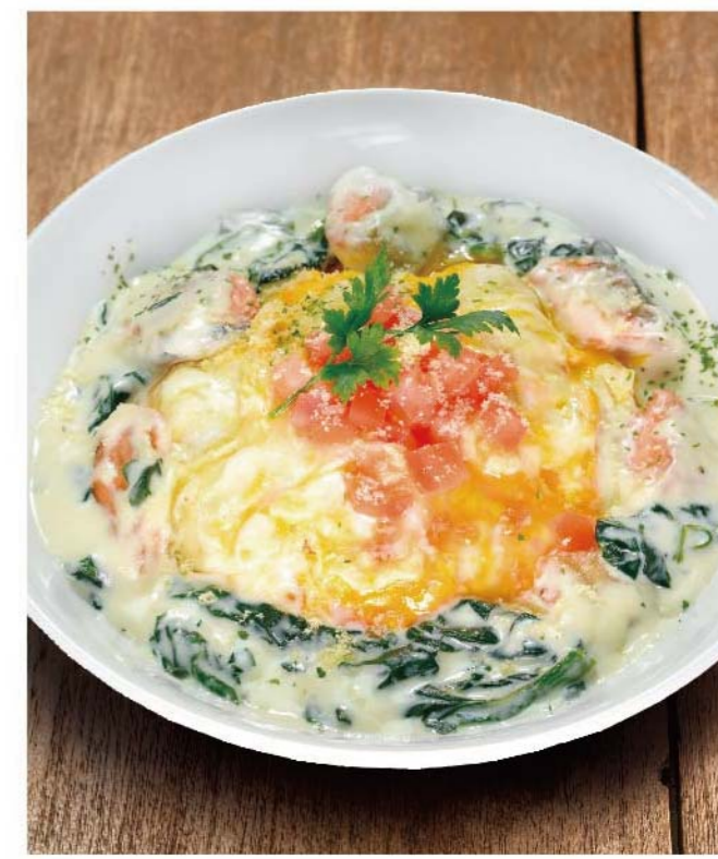
サーモンとほうれん草のミルクオムライス 十六穀米バターライス ..... 1,000円(税込1,100円)