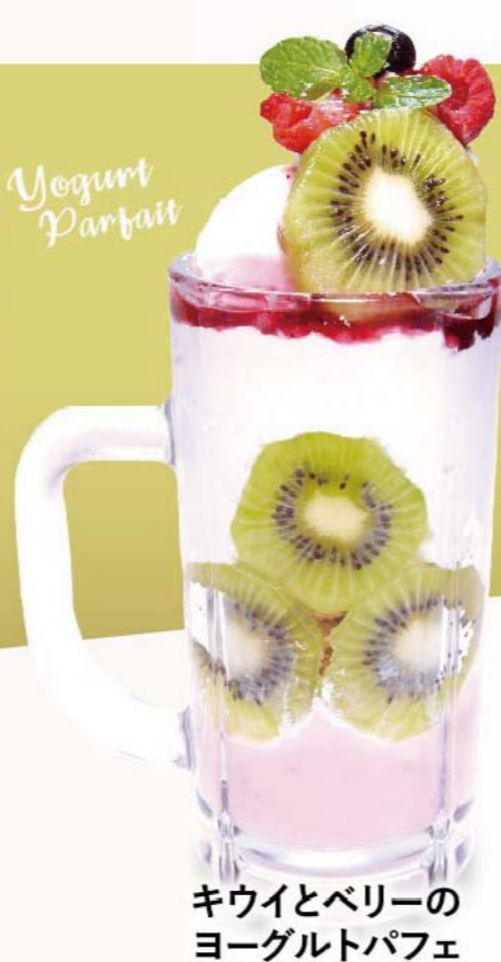
キウイとベリーの ヨーグルトパフェ