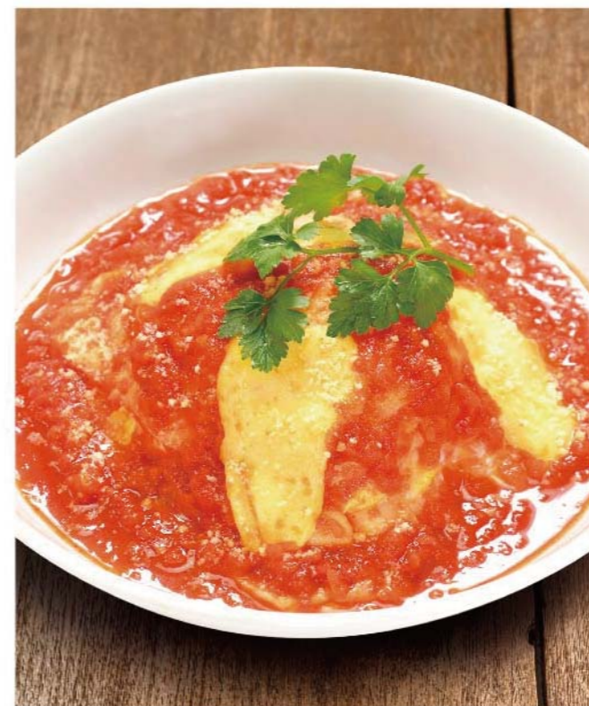
完熟トマトとモッツァレラのオムライス チキンライス ..... 950円(税込1,045円)