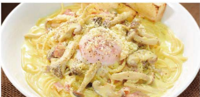
いろいろキノコと ベーコンのカルボナーラ 1,000円(税込1,100円)