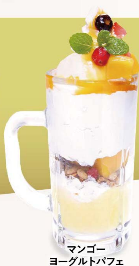
マンゴー ヨーグルトパフェ