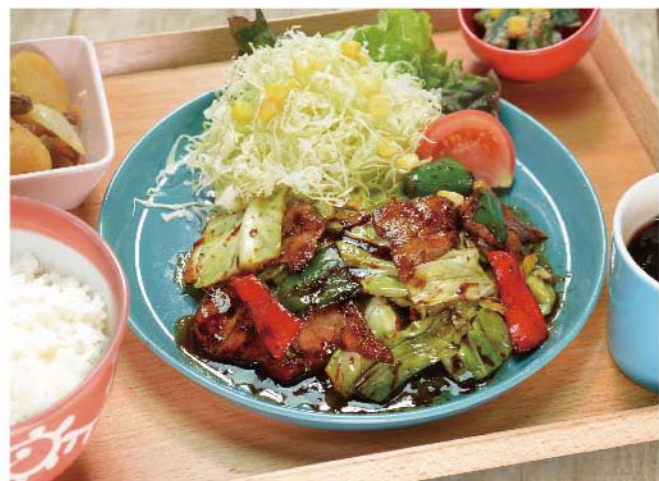
豚肉と野菜の味噌炒め定食 ..... 1,000円(税込1,100円)