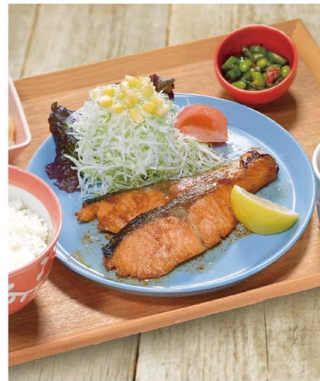
サーモンの焦がしバター焼き定食 ..... 1,100円(税込1,210円)