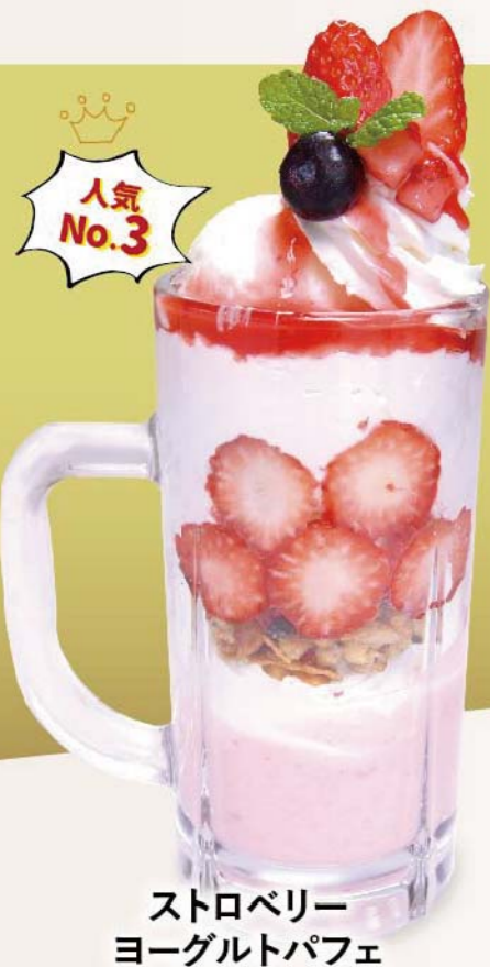
ストロベリー ヨーグルトパフェ