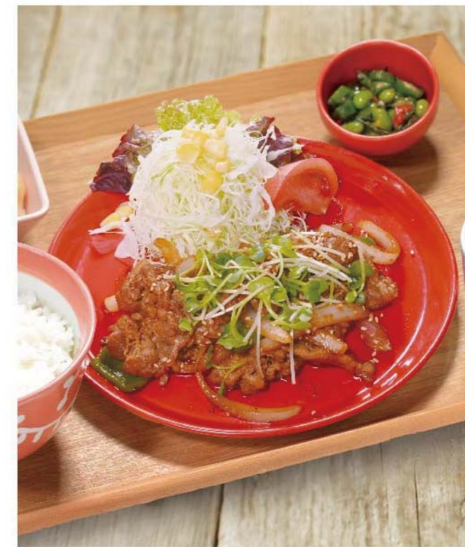
牛カルビ焼肉定食 ..... 1,100円(税込1,210円)