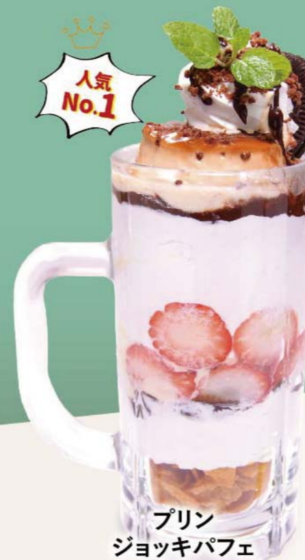
プリン ジョッキパフェ