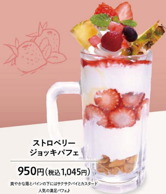
ストロベリー ジョッキパフェ