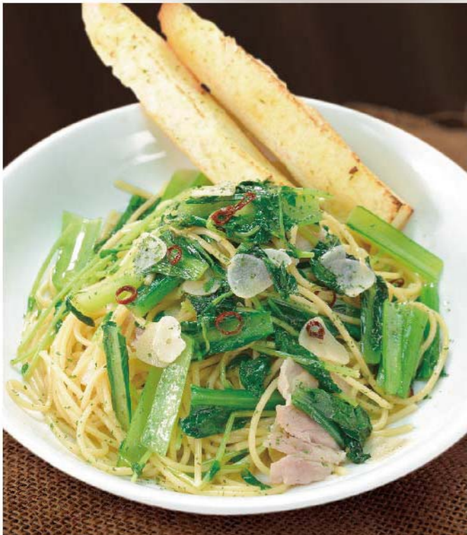
青菜と塩豚のペペロンチーノ 900円(税込990円)