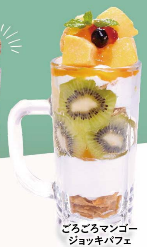
ごろごろマンゴー ジョッキパフェ