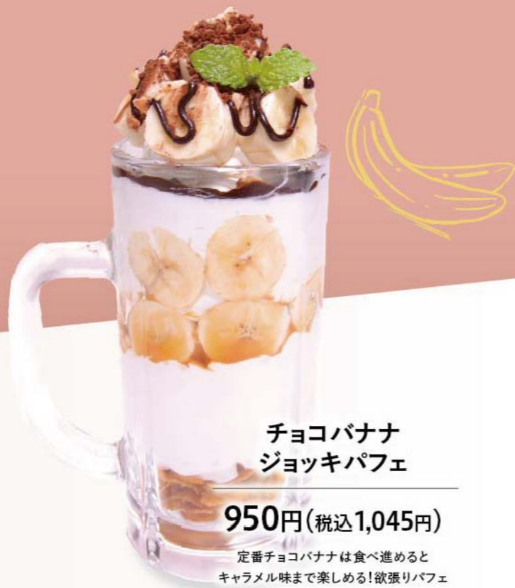
チョコバナナ ジョッキパフェ