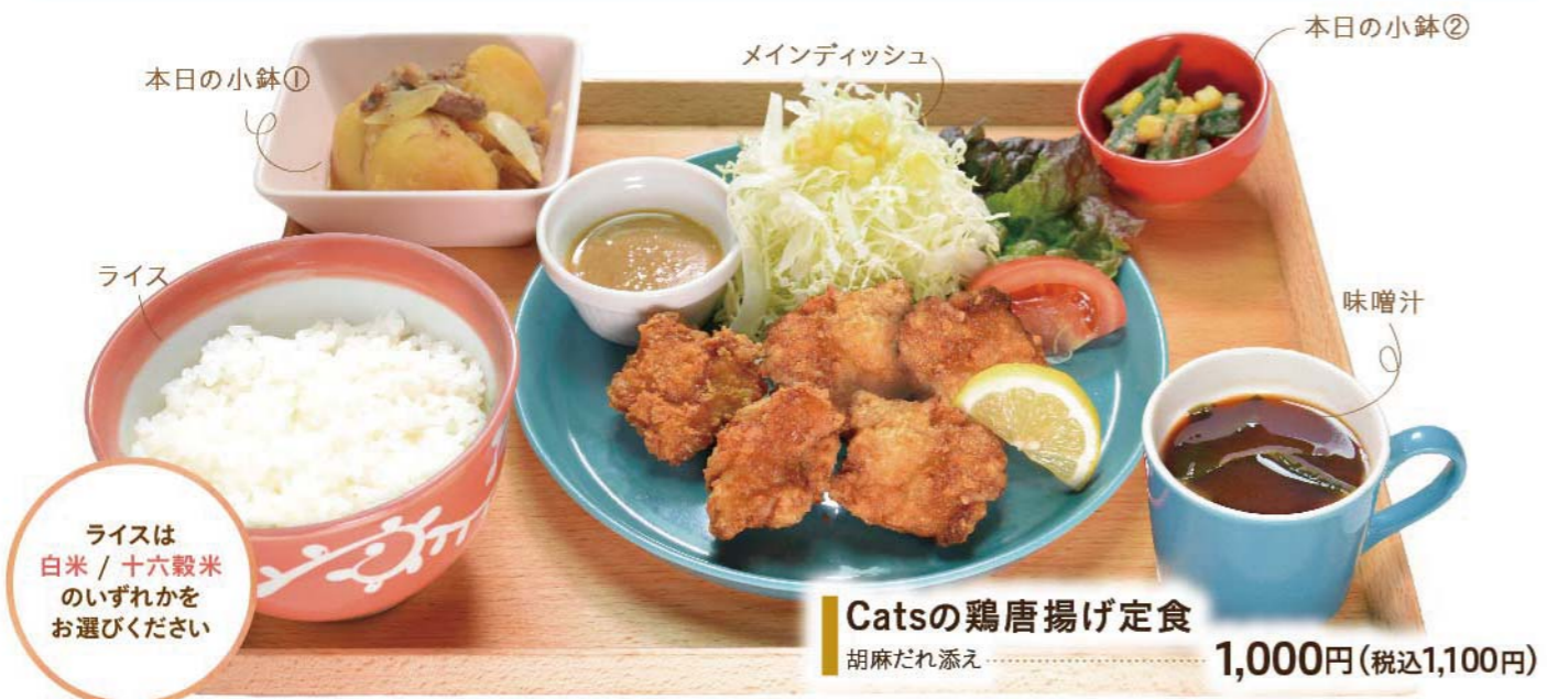
Catsの鶏唐揚げ定食 胡麻だれ添え ..... 1,000円(税込1,100円)