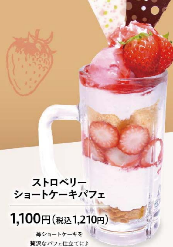
ストロベリー ショートケーキパフェ