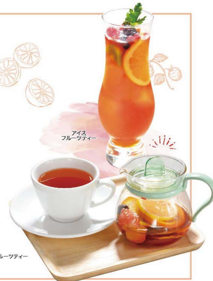
アイスフルーツティー