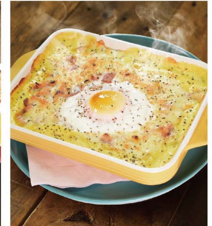
濃厚カルボナーラ風ドリア 950円(税込1,045円)