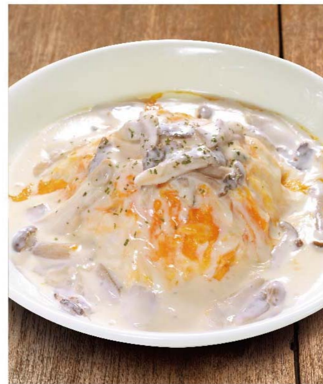
きのこのゴルゴンゾーラクリームオムライス チキンライス ..... 1,050円(税込1,155円)