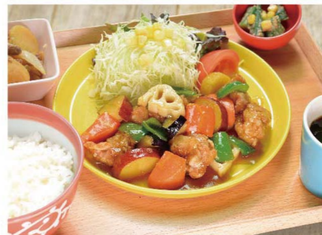
鶏と根菜の甘酢あん定食 ..... 1,100円(税込1,210円)