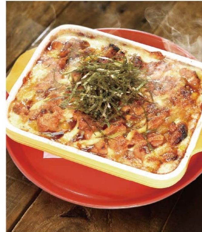
照り焼きチキンの和風ドリア 900円(税込990円)