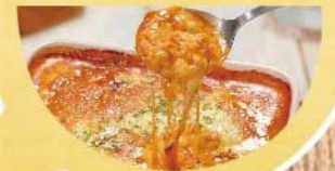
モzzarellaのミートドリア 900円(税込990円)