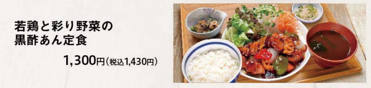
若鶏と彩り野菜の 黒酢あん定食 1,300円(税込1,430円)