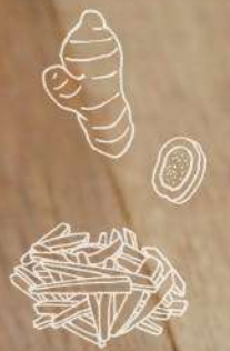
ポークジンジャーステーキ 900円(税込990円)

針しょうがと おろししょうがの 爽やかな香りと風味が 香ばしく甘い豚肉と 相性ピッタリ!