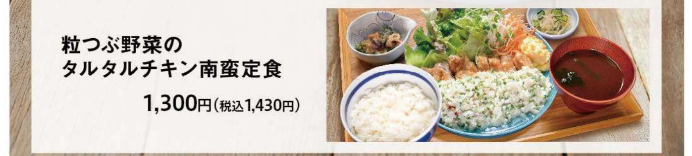
粒つぶ野菜の タルタルチキン南蛮定食 1,300円(税込1,430円)