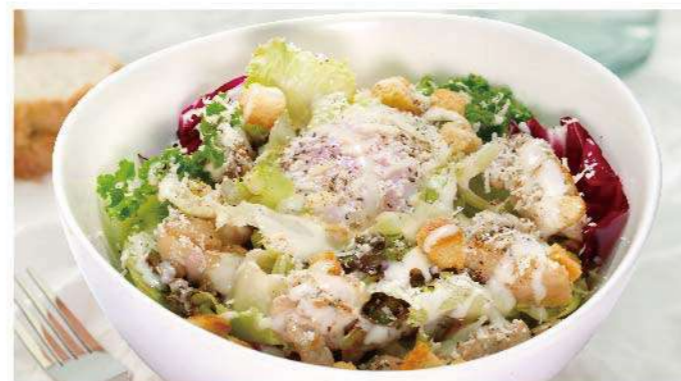
半熟卵とチキンのシーザーサラダ 700円(税込770円)