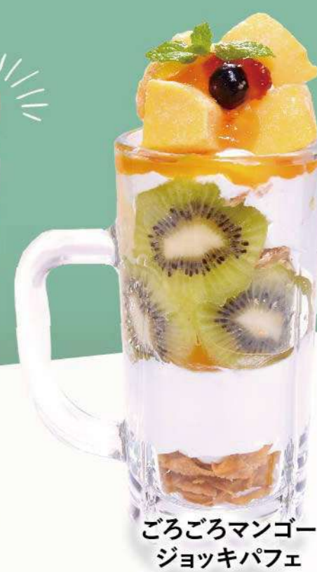
ごろごろマンゴー ジョッキパフェ