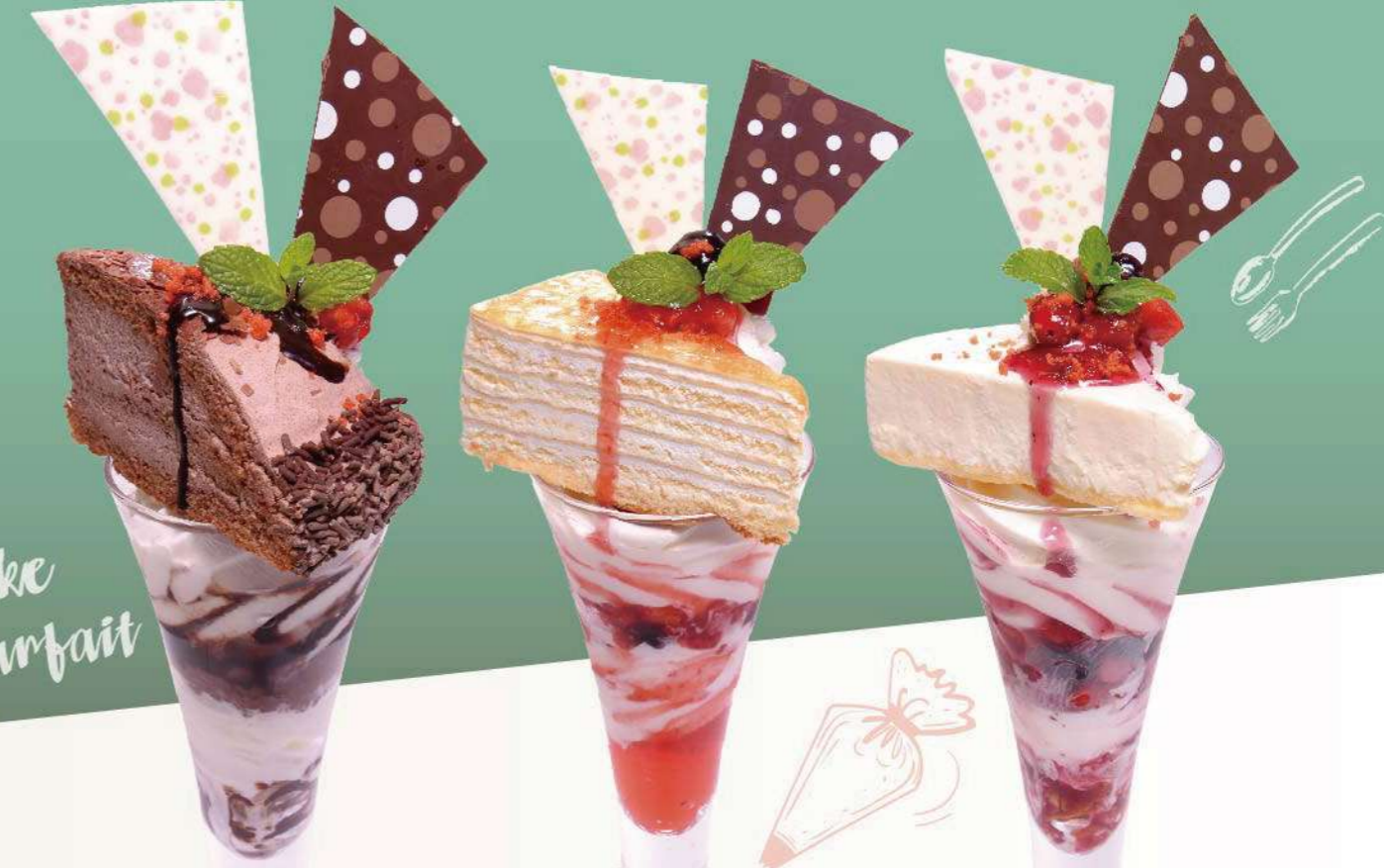
ショコラケーキパフェ