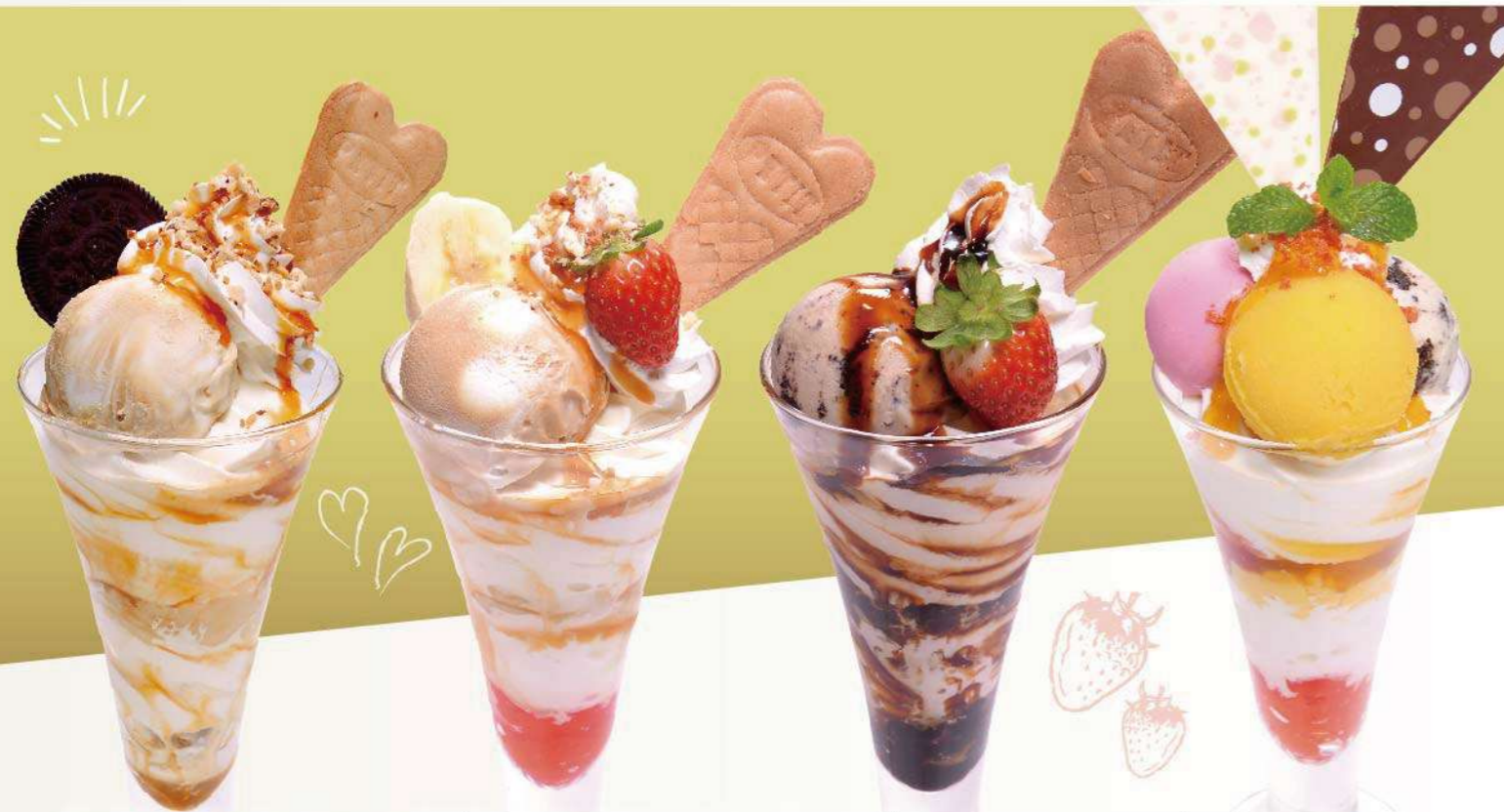
キャラメルナッツパフェ