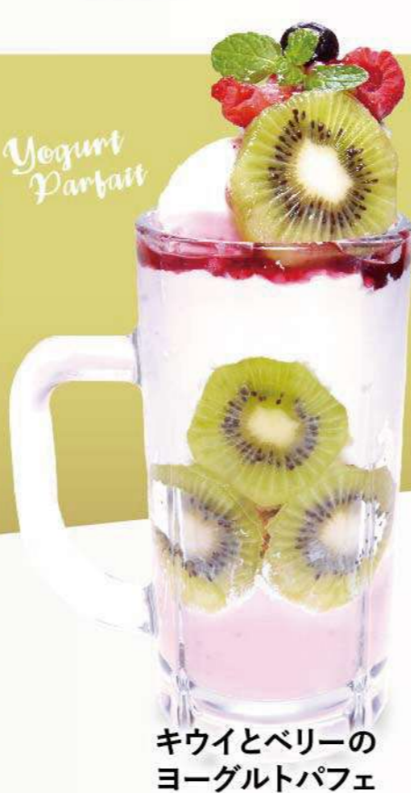
キウイとベリーの ヨーグルトパフェ