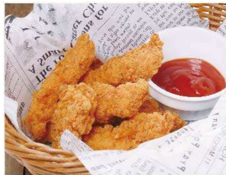
ミニフライドチキン 600円(税込660円)