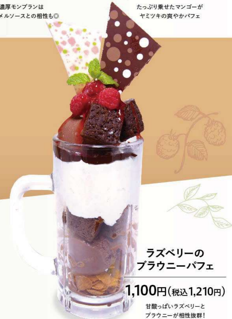
ラズベリーの ブラウニーパフェ