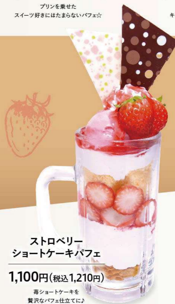
ストロベリー ショートケーキパフェ