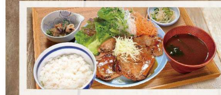
ポークジンジャー ステーキ定食 1,300円(税込1,430円)