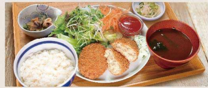
ビストロ蟹クリーム コロッケ定食 1,300円(税込1,430円)