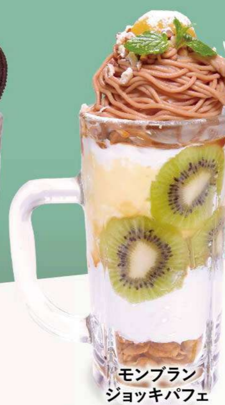
モンブラン ジョッキパフェ