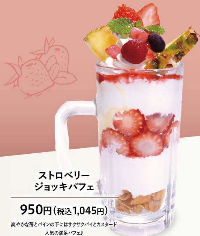
ストロベリー ジョッキパフェ