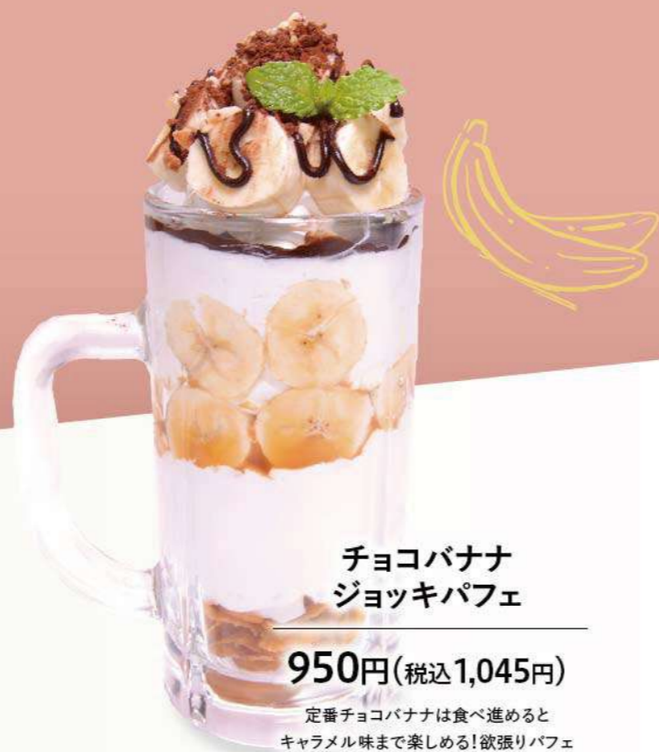
チョコバナナ ジョッキパフェ