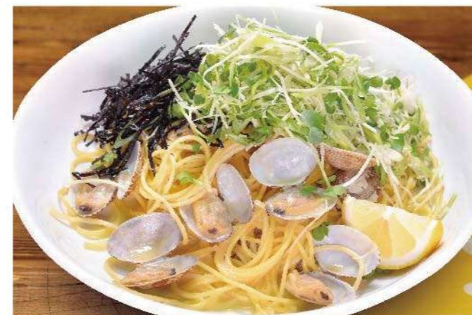
たっぷり香味野菜のジンジャーボンゴレ 1,200円(税込1,320円)