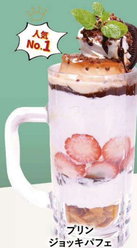
プリン ジョッキパフェ