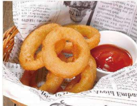
オニオンリングフライ 500円(税込550円)