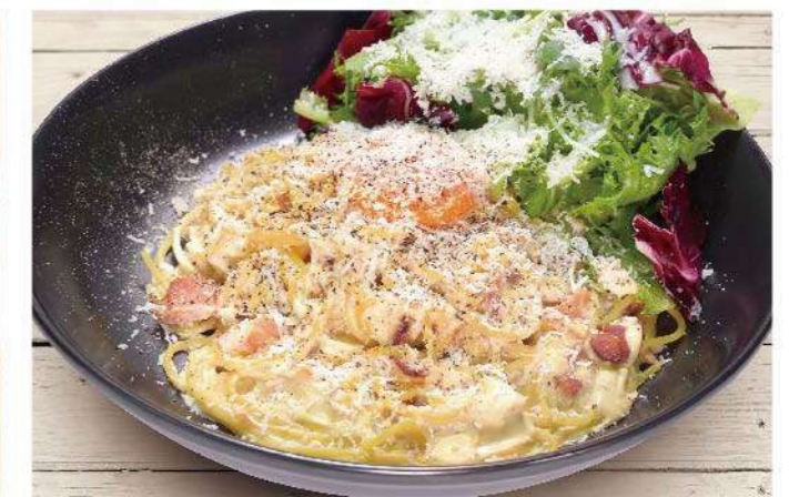
たっぷりすりおろしチーズのカルボナーラ 1,100円(税込1,210円)