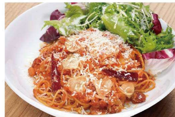
ニンニクと唐辛子のトマトソース 1,000円(税込1,100円)