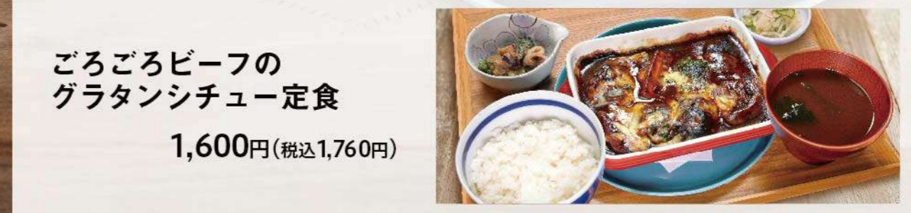
ごろごろビーフの グラタンシチュー定食 1,600円(税込1,760円)