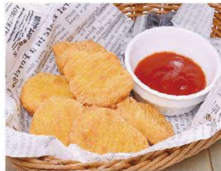
チキンナゲット 600円(税込660円)