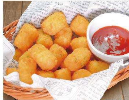
ちびまるハッシュドポテト 500円(税込550円)