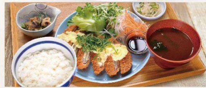
2種のチーズ ミルフィーユカツ定食 1,400円(税込1,540円)