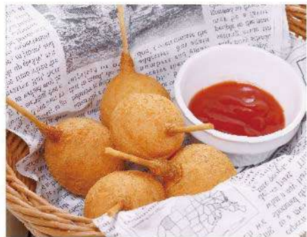
ミニチーズドッグ 600円(税込660円)