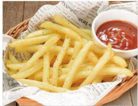
Catsフライポテト 500円(税込550円)