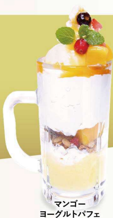
マンゴー ヨーグルトパフェ