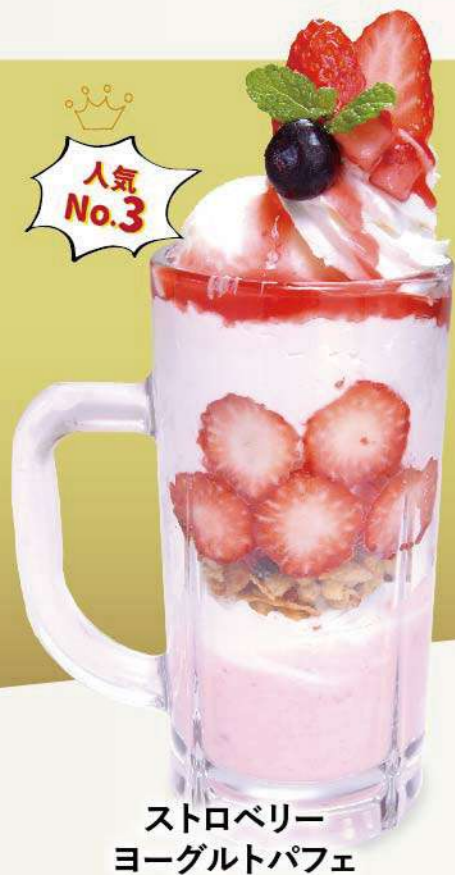
ストロベリー ヨーグルトパフェ