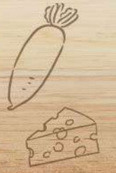
2種のチーズ ミルフィーユカツ 1,000円(税込1,100円)