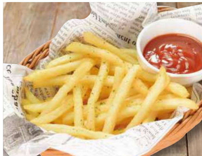
Catsフライポテト 600円(税込660円)