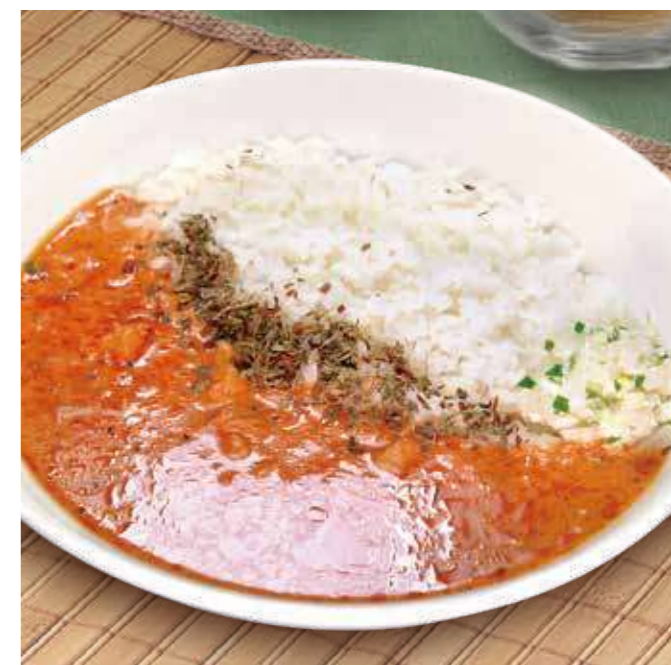
Catsのバターチキンカレー 🔥🔥 1,000円(税込1,100円)