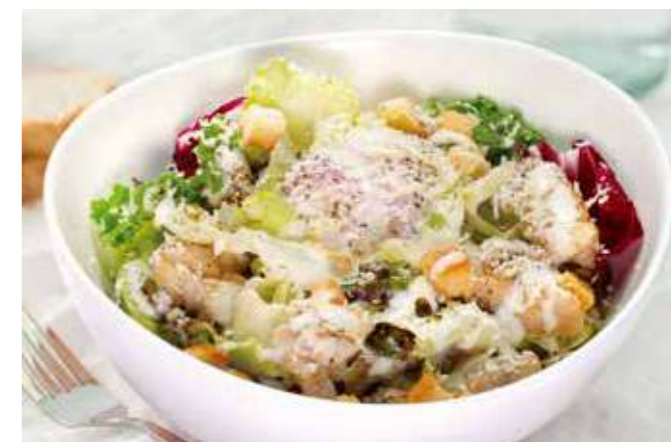
半熟卵とチキンのシーザーサラダ 750円(税込825円)