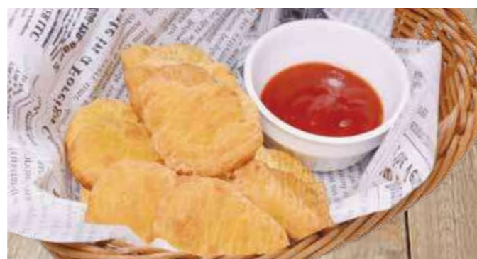
チキンナゲット 650円(税込715円)