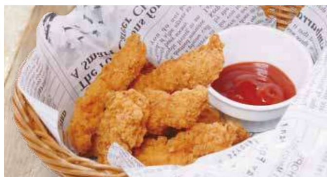
ミニフライドチキン 650円(税込715円)