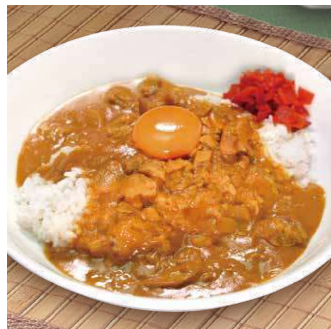
こだわり総料理長カレー 🔥🔥🔥 1,000円(税込1,100円)