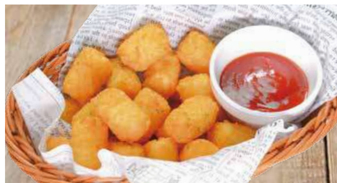
ちびまるハッシュドポテト 650円(税込715円)