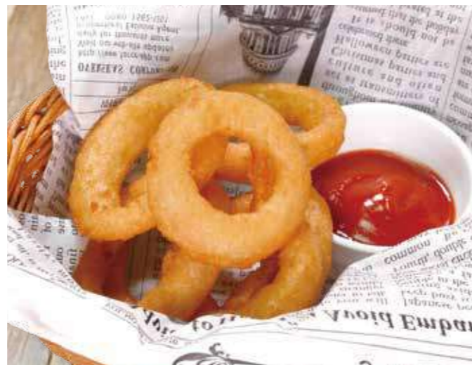
オニオンリングフライ 600円(税込660円)