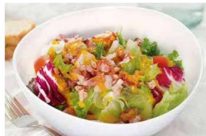
人参ドレッシングのベーコンレタスサラダ 750円(税込825円)