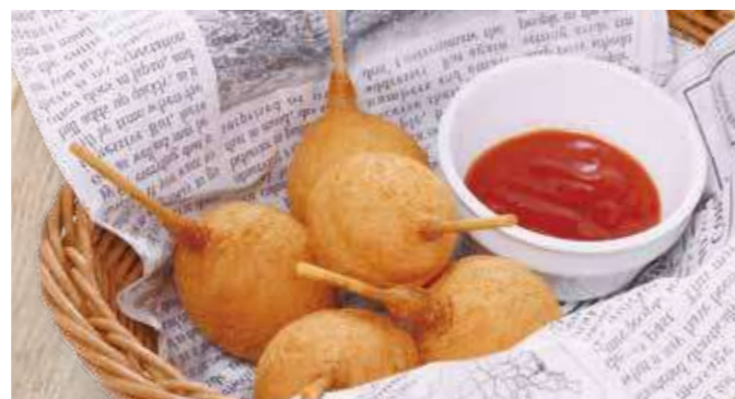
ミニチーズドッグ 650円(税込715円)