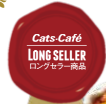
PLATE DESSERT — プレートデザート —

モンブラン パフェ 1,250円(税込1,375円) 栗のアイ스에自家製モンブランクリームを たっぷり絞りバナナとキャラメルを 合わせた濃厚パフェ Mont Blanc