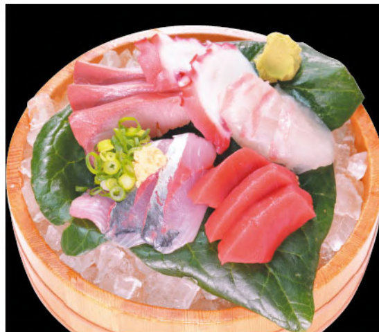
刺身5点盛り 1,600円(税込1,760円)