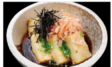
揚げ出し豆腐 600円 (税込660円)