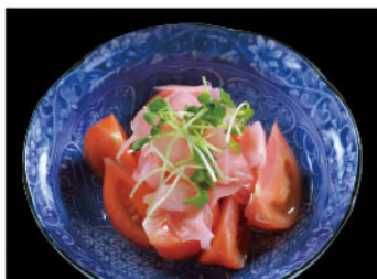
ガリトマト 450円(税込495円)