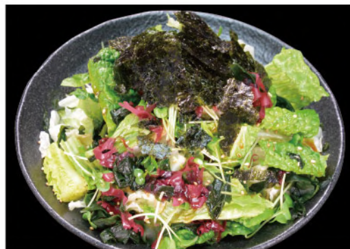
海藻千コレギサラダ 700円(税込770円)