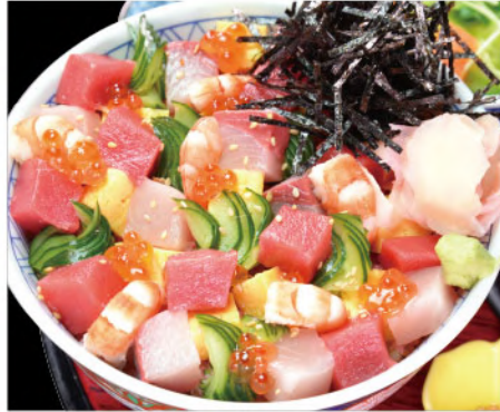
パラちりし丼 1,650円(税込1,815円)