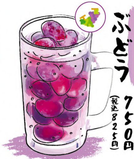
ぶどう 750円 (税込825円)