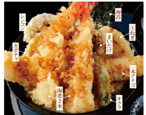
マルサ上天丼 1,800円(税込1,980円)