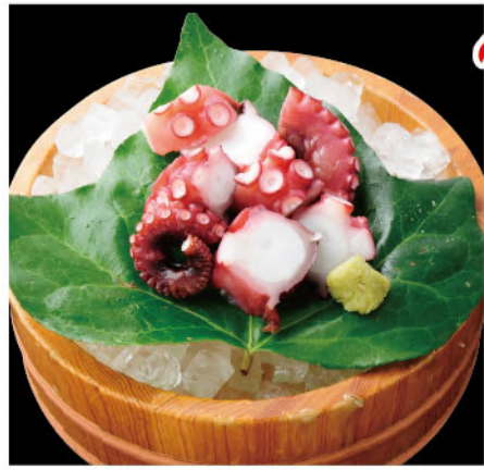
たこぶつ 700円(税込770円)