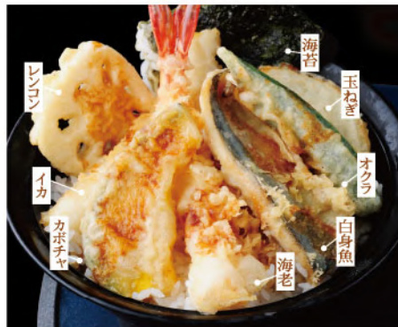
マルサ天丼 1,500円(税込1,650円)