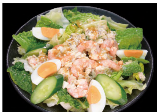
海老のタレタレサラダ 900円(税込990円)