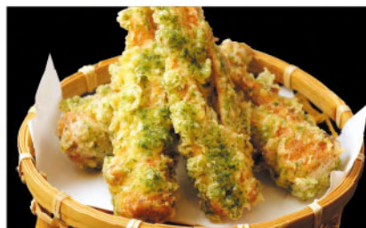
ちくわ磯辺揚げ 450円 (税込495円)