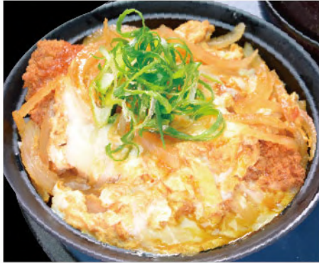
マクロカツ丼 1,500円(税込1,650円)