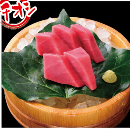
ホマツロ赤身 700円(税込770円)

マレサのホマツロはホマツロ 口にいれた瞬間、まろやかな感覚をホロの中身に ながら甘さは天然のホマツロならではの時です。 マレサホマツロ(赤身)はこのホマツロを使っています。