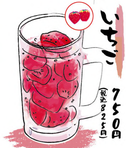
いちご 750円 (税込825円)