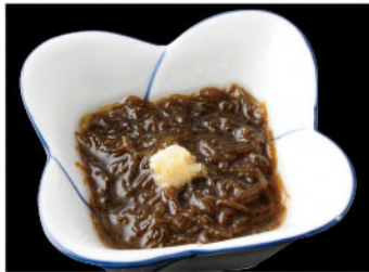
沖縄のたもずく酢 350円(税込385円)