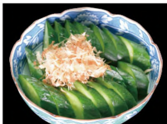
きゅうりの浅漬け 500円(税込550円)