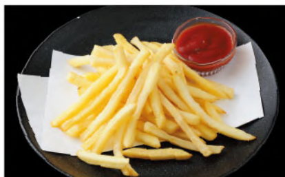
薬塩仕立てのポテトフライ 450円 (税込495円)