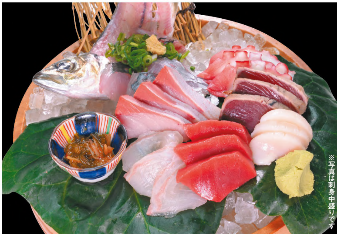
※写真は刺身中盛りです

マリンの料理長長渾身の一品！ 今日は豪華に刺盛りです。 ※仕入れにより内容が変わることがあります。