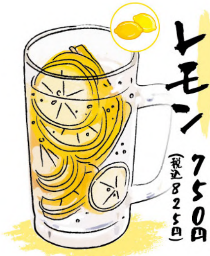
レモン 750円 (税込825円)