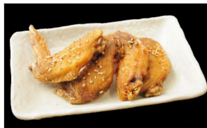
手羽先の唐揚げ 600円 (税込660円)