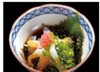
コリコリクラゲポン酢 500円(税込550円)