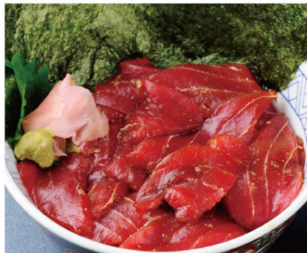
幸まぐろ漬け丼 1,800円(税込1,980円)