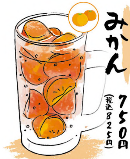
みかん 750円 (税込825円)