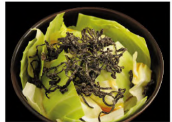
こぶ塩キャベツ 400円(税込440円)