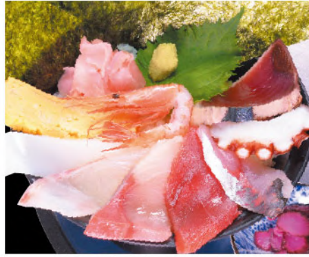
マルサ海鮮丼 1,450円(税込1,595円)