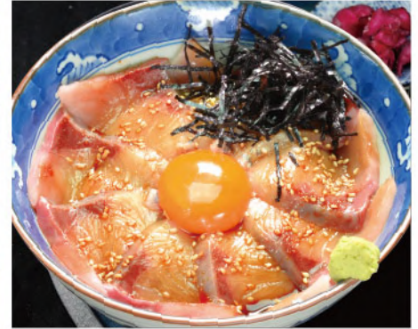
マルサのグリ丼 1,650円(税込1,815円)