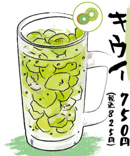
キウイ 750円 (税込825円)