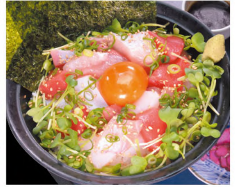
海鮮ユッケ丼 1,450円(税込1,595円)