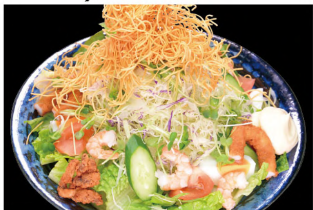
マルサ特製サラダ 1,000円(税込1,100円)