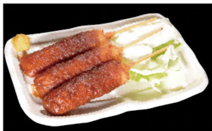
味噌串カツ 500円 (税込550円)