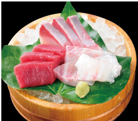
刺身3点盛り 1,200円(税込1,320円)