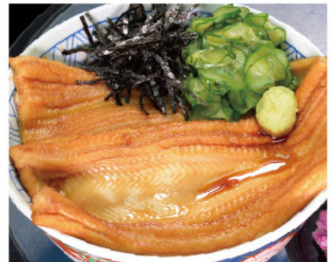
特上煮あなご丼 1,900円(税込2,090円)