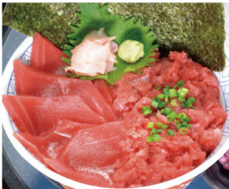
幸まぐろネギトロ鉄火丼 1,800円(税込1,980円)